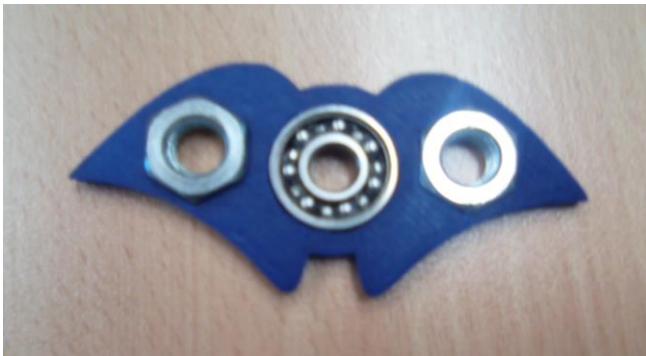
Spinner tipo "Batman" diseñado por un alumno de 1º de ESO

Aprenderemos a diseñar en 3 dimensiones cualquier objeto o juguete, que podría imprimirse en una impresora 3D.